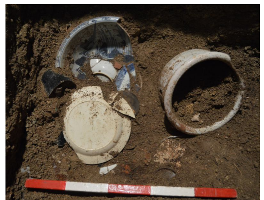
Louças domésticas recolhidas na zona de frio.

Após o terramoto de 1755 todo o espaço foi reerguido, dando origem ao atual imóvel.