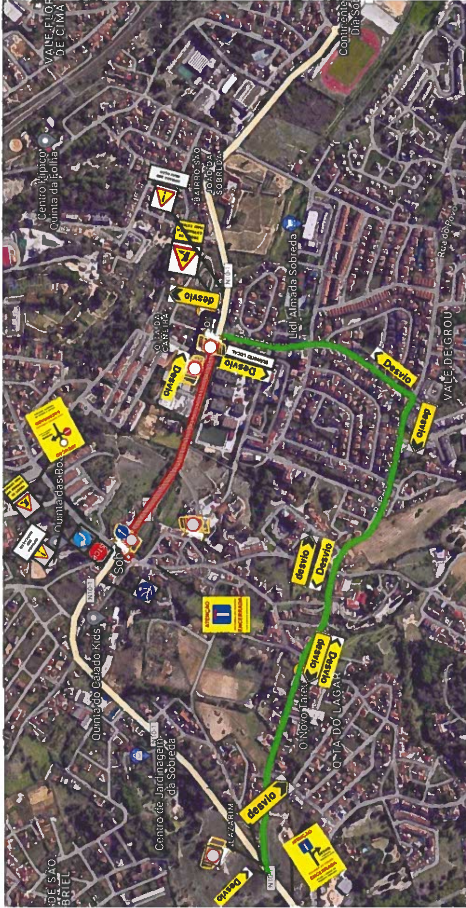
Fase 3.1 – Trabalhos entre a Rotunda e a Avenida da República